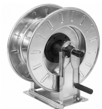
Dimensions (mm) / Dimensioni (mm)