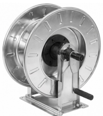
Dimensions (mm) / Dimensioni (mm)