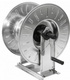
Dimensions (mm) / Dimensioni (mm)