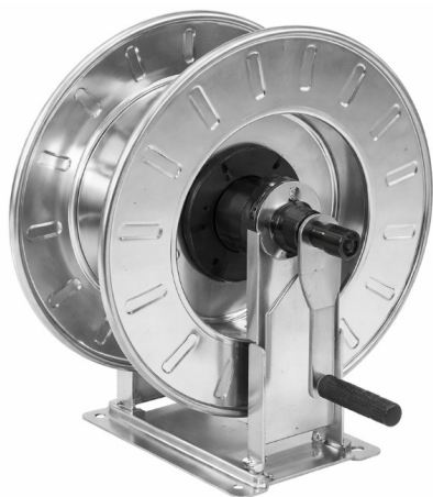
Dimensions (mm) / Dimensioni (mm)