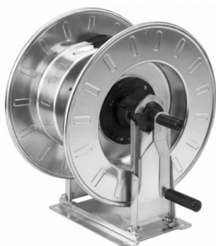
Dimensions (mm) / Dimensioni (mm)