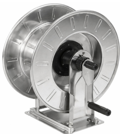
Dimensions (mm) / Dimensioni (mm)