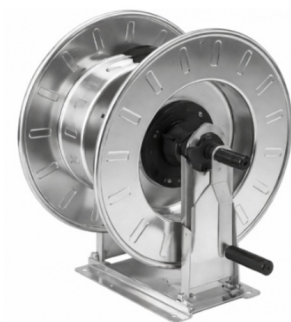
Dimensions (mm) / Dimensioni (mm)