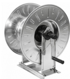
Dimensions (mm) / Dimensioni (mm)