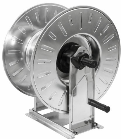
Dimensions (mm) / Dimensioni (mm)